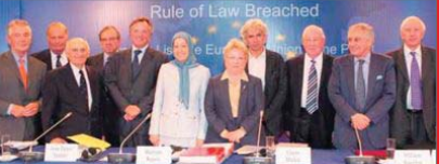
Rule of Law Breached

انتونیو کبیسه، قاضی دادگاه بین‌المللی حریری، مشاور حقوقی اصلی سازمان مناقضین قوی بوده است. این ایتالیایی ۳۳ ساله است که کارنامه خود ریاست دادگاه بین‌المللی جنایت‌های جنگی در یوگسلاوی سابق (۱۹۹۳ تا ۱۹۹۷) را داشت. در سال ۲۰۰۴ نیز توسط کوفی عنان، دبیرکل وقت سازمان ملل، به‌عنوان کمیته تحقیقاتی بین‌المللی دارفور منصوب شد. کبیسه از اکتبر ۲۰۰۸ به‌عنوان مشاور