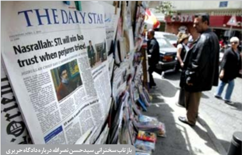
بازتاب سخنرانی سیدحس نصرالله درباره دادگاه حریری

فتنه با کوچکترین جرقه به‌سرعت شعله‌ور می‌شود. در طول ماهه و هفته‌های اخیر همه منتظر بدهداند تا با اعلام اتهام حزب‌الله در قتل حریری، بحران و درگیری جدیدی در لبنان آغاز شود. مردم که از زمان جنگ‌های داخلی به چنین شرایطی عادت دارند از مدت‌ها قبل خود را برای این روزها آماده کرده‌اند. سبب بسیاری مردمغذایی و لوازم ضروری را تهیه کرده‌اند و روز سه‌شنبه بعد از اعلام بلاغ رسمی حکم اتهامی از سوی دادگاه، برخی از خانه‌های خود بیرون نیامدند و بسیاری از مدارس تعطیل بود.