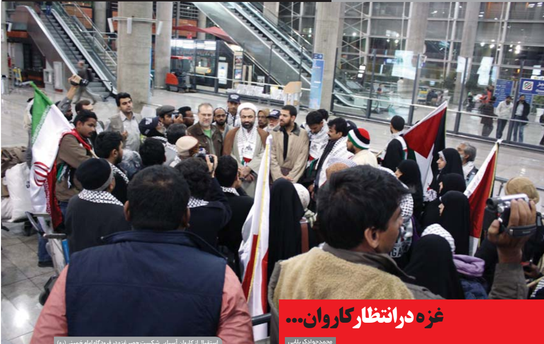
استقبال از کاروان آسیایی شکست حصر غزه در فرودگاه امام خمینی (ره)