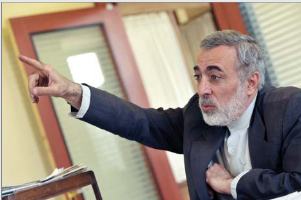
دبیر کل کنفرانس بین المللی پشتیبانی از انتفاضه